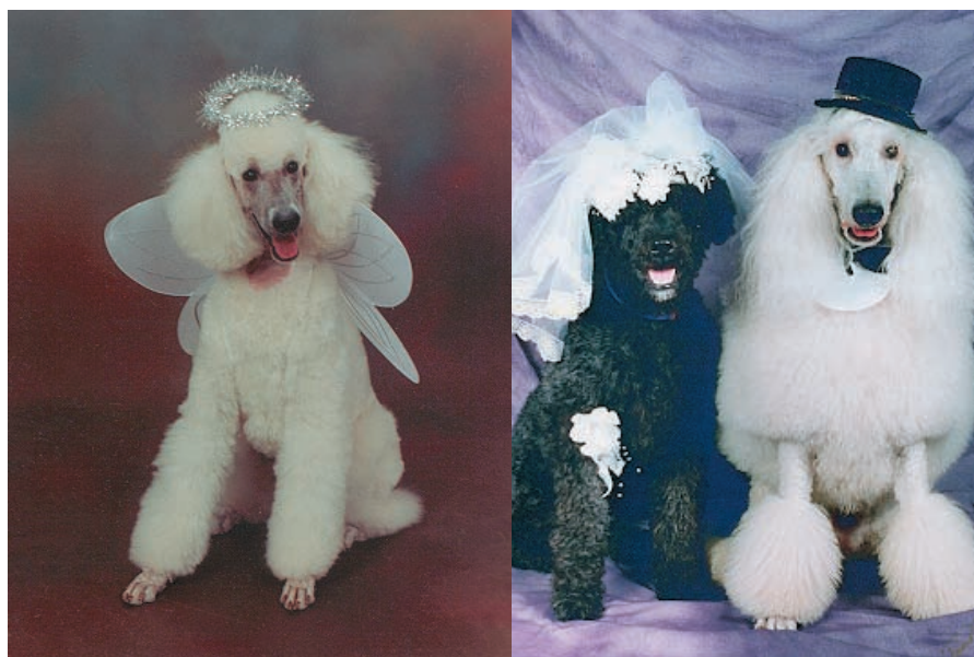
Amusant ou avilissant?