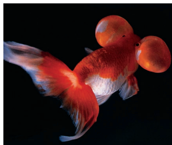
Les poissons rouges dits «poissons aux yeux protubérants», issus d'un élevage forcé, ont les yeux agrandis et tournés vers le haut. Dessous, on constate des excroissances à peau fine emplies de liquide, pouvant atteindre la taille d'un œuf de pigeon. La vue du poisson est de ce fait très réduite.

La majorité des membres des deux commissions estime que les contraintes imposées aux animaux selon différents critères (maux, souffrances, états d'anxiété, dommages, intervention modifiant l'apparence, avilissement et instrumentalisation abusive) représentent une atteinte à la dignité de la créature. Une pondération des intérêts en présence pourra éventuellement démontrer qu'une atteinte à la dignité peut se justifier lorsque les intérêts de l'homme ont été jugés plus importants que les intérêts de l'animal. La dignité de l'animal est considérée comme étant respectée dès lors que dans le cadre d'une pondération des intérêts soigneusement effectuée, l'atteinte qui lui est portée a pu faire l'objet d'une justification. En revanche, on considère que l'intervention prévue ne respecte pas la dignité de l'animal lorsqu'une pondération des intérêts en présence a conclu que les intérêts de l'animal ont plus de poids que les intérêts qui lui sont opposés.